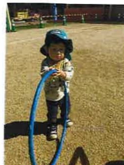
外あそびが一番 だいきき!!