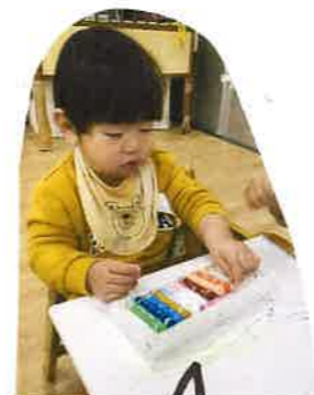
ほともお絵描き だいきき