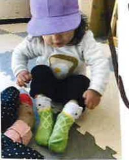
みてみて😊 くつ下だてはわかるよ