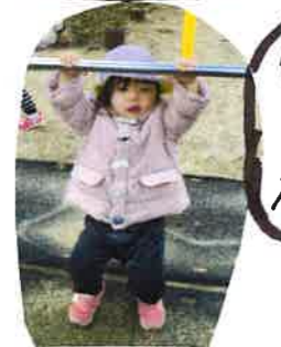
鉄棒にも ぶら下がれ るよ