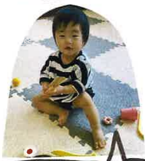
この頃は、まだまだ 赤ちゃんだったね♡