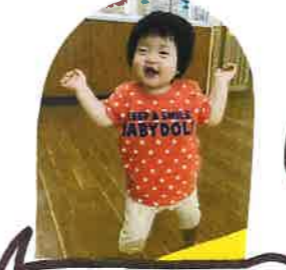
いつもこの笑顔に いせされてたよ♡