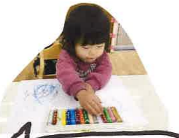
お絵描きや製作が だいきき