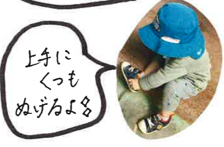
上手に くつも ぬげるよ