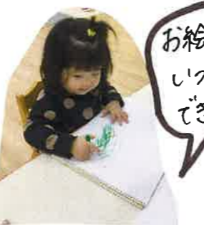
お絵描きはう いっまでも できるよ!!