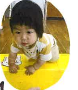
この頃から 積み木そのほり おけるの、好き だったね♡