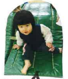
マットの上 だいきき