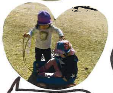
今はういちゃん はのこいよよし